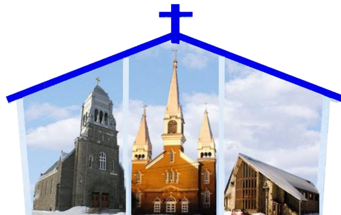
Saint-Philippe Saint-Louis –de-France Saint-Michel de Wentworth

Bureau situé au : 354 rue Principale Brownsburg-Chatham. Qc. J8G 2V7 Téléphone : 450 -533-6314