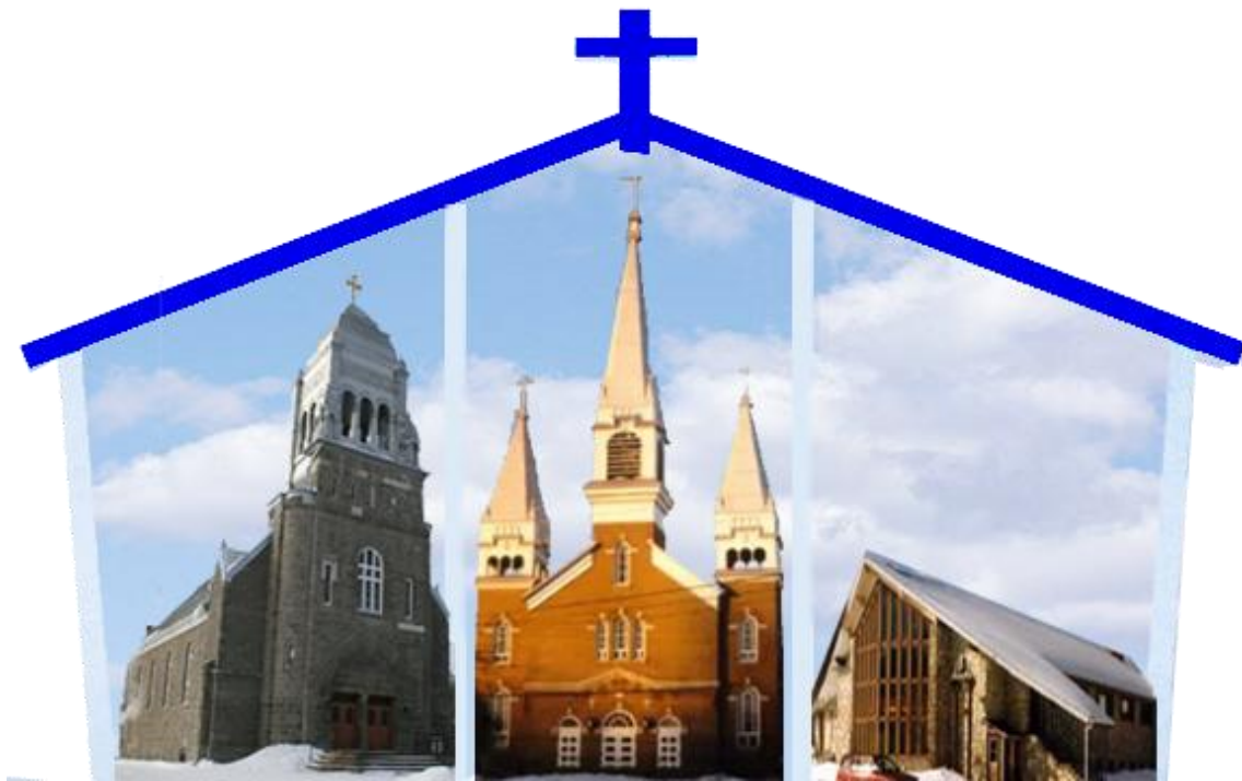
Saint-Philippe Saint-Louis –de-France Saint-Michel de Wentworth

Bureau situé au : 354 rue Principale Brownsburg-Chatham. Qc. J8G 2V7 Téléphone : 450 -533-6314