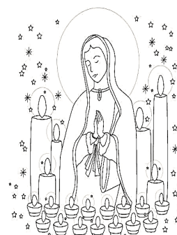
l'Immaculée Conception 8 décembre

Le pape Pie IX promulgua le dogme de l'immaculée Conception, le 8 décembre 1854 en la déclarant préservée du péché originel dès sa naissance : « Nous déclarons, prononçons et définissons que la doctrine qui tient que la bienheureuse Vierge Marie a été, au premier instant de sa conception, par une grâce et une faveur singulière du Dieu tout puissant, en vue des mérites de Jésus Christ, Sauveur du genre humain, préservée intacte de toute souillure du péché originel, est une doctrine révélée de Dieu, et qu'ainsi elle doit être crue fermement et constamment par tous les fidèles ».